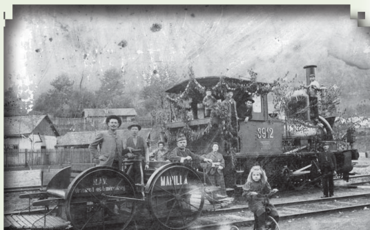
ANINA – locomotivă în gară.