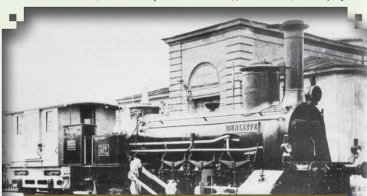
Locomotiva cu abur nr. 502 „GERLISTE”.