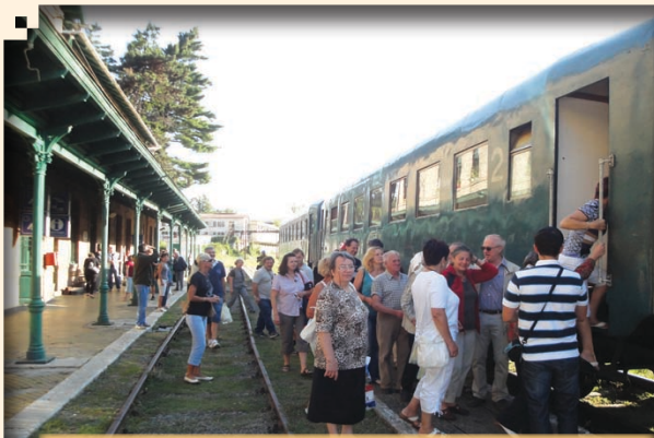
Gara ANINA, plecarea cu trenul la Oravița.

În zilele de 27-28 august 2011, Școala cu clasele I-VIII nr. 2 din Steierdorf a sărbătorit Jubileul de 100 de ani de la construirea acestei mărețe clădiri – inaugurată oficial și sfințită la data de 05 noiembrie 1911. Primăria orașului Anina, Consiliul Local, Grupul Școlar «Mathias Hammer», Forumul Democrat al Germanilor din Steierdorf-Anina, Școala sărbătorită și Asociația „Heimatsortgemeinschaft Steierdorf-Anina” E.V. au organizat, cu acest prilej, o serie de activități la care au fost invitați toți foștii și actualii învățători, profesori și absolvenți! Trebuie menționat faptul că, această manifestare de excepție a fost posibilă datorită implicării