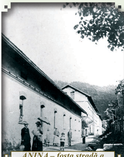
ANINA – fosta stradă a funcționarilor, poreclită strada „Sărut mâna!”, azi strada Poștei – 1890.

În anul 1878 colonia Anina număra deja peste 6.000 de credincioși romano-catolici, iar în anii care au urmat, aceștia au devenit mult mai numeroși și capela romano-catolică din Anina a ajuns, în curând, neîncăpătoare. Din această cauză, St.E.G. – în calitate de patron, cere încuviințarea autorităților Diocezei de Cenad, de care aparținea comuna, pentru crearea unei parohii independente de cea din Steierdorf. În urma avizului favorabil primit, societatea pune la dispoziție un salariu de 600 fl., 40 m.st. lemn de foc pentru preotul noii parohii și, începând cu data de 01 noiembrie 1888, credincioșii romano-catolici din Anina dispun de o parohie proprie. Episcopia numește ca prim preot al noii înființate parohii, pe preotul KARL GRÜNN. Începând cu aceeași dată, matricolele au fost completate separat față de cele din Steierdorf.