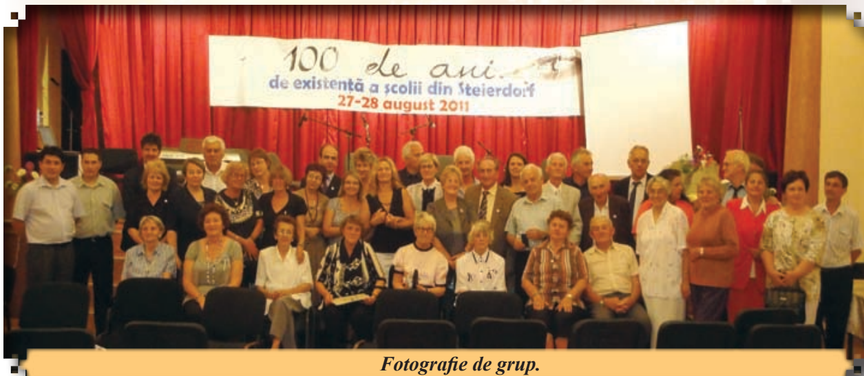
Fotografie de grup.

Și pe această cale, dorim să mulțumim tuturor, atât organizatorilor cât și invitațiilor, pentru acest minunat omagiu adus Școlii din Steierdorf și, nu în ultimul rând, învățământului din orașul nostru.