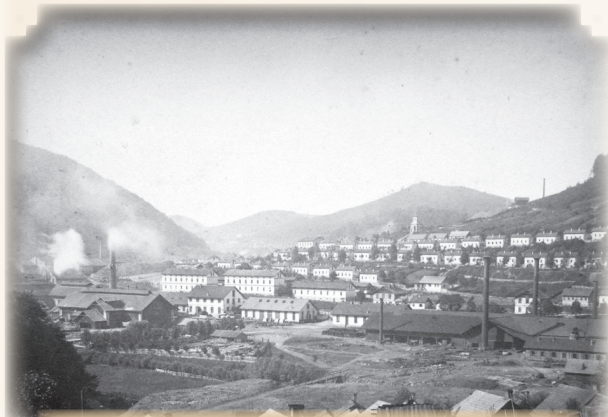
ANINA - văzută din curtea Uzinelor de Fier, 1898.

În a doua zi de Crăciun, la 26 decembrie 1897, în urma împușcării efectuate la puțul THINNFELD II., în vederea adâncirii acestuia, este accidentat mortal JOSEF HUML.