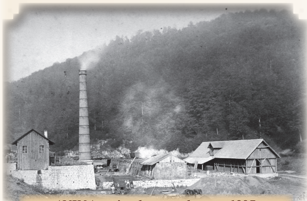
ANINA - primul cuptor de coals, 1897.