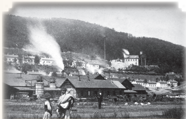
ANINA - parte a Uzinelor de Fier și puțul RONNA, 1898.

În anul 1898, urmare unei legi a Guvernului Ungar, toate localitățile regatului vor avea denumiri maghiare. Astfel, comuna Steierdorf se va numi de-acum: STAJERLAK.